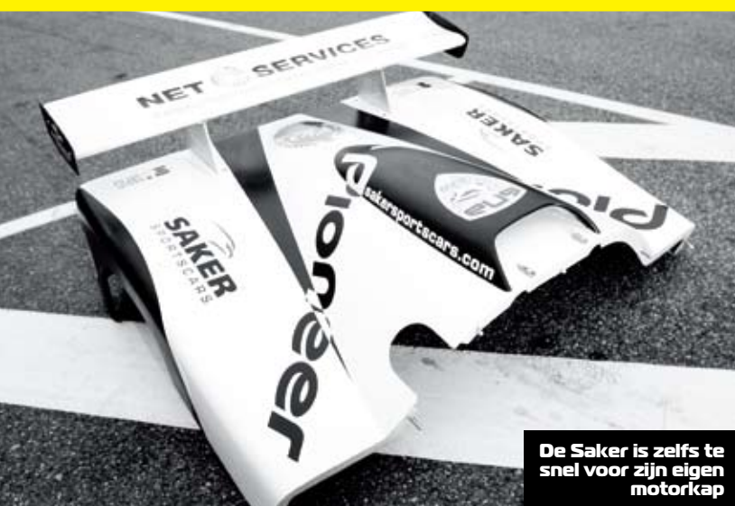
De Saker is zelfs te snel voor zijn eigen motorkap