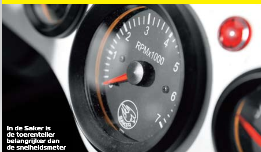
In de Saker is de toerenteller belangrijker dan de snelheidsmeter