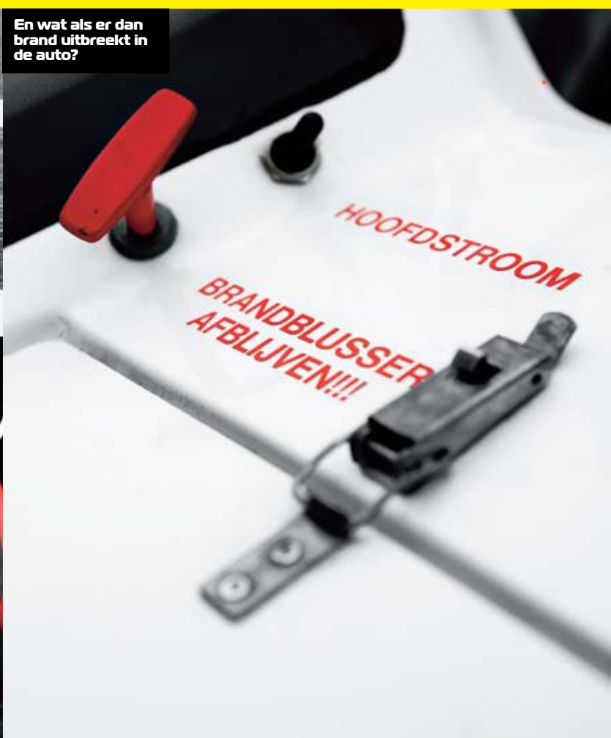
En wat als er dan brand uitbreekt in de auto?